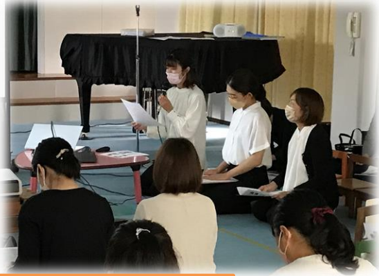
年齢ごとにはるのプロジェクトの発表