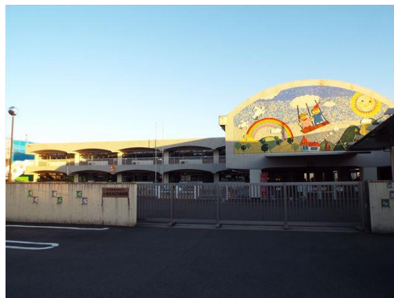
初日に映える園舎